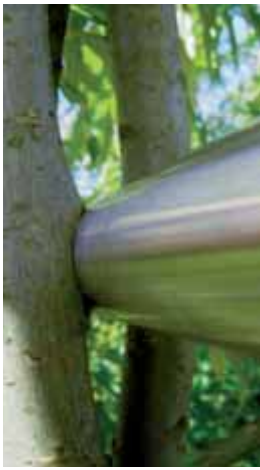
1 Buerau Baubotanik (4)