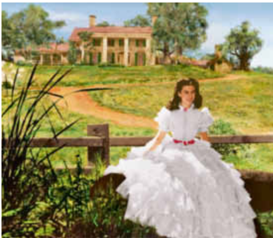
5 Filmstill; Victor Fleming, USA 1939

Kulturell hybride Erinnerungslandschaften haben sich in Südamerika entwickelt. Im 17. und 18. Jahrhundert gründeten Jesuiten auf dem Gebiet von Paraguay, Bolivien und Südbrasilien sogenannte Reduktionen (von spanisch reducir = zusammenführen), in denen die nomadischen Indianer in festen Siedlungen zusammengeführt wurden. Das Ziel war, die Indigenen zu christianisieren, vor der Ausbeutung zu schützen und zu «zivilisierten Wesen» zu entwickeln. Die Folge war eine grundlegende Umgestaltung des als «Naturlandschaft» bewerteten Gebietes 3 in eine mit befestigten Siedlungen durchsetzte, nach europäischen Konzepten strukturierte Kulturlandschaft.